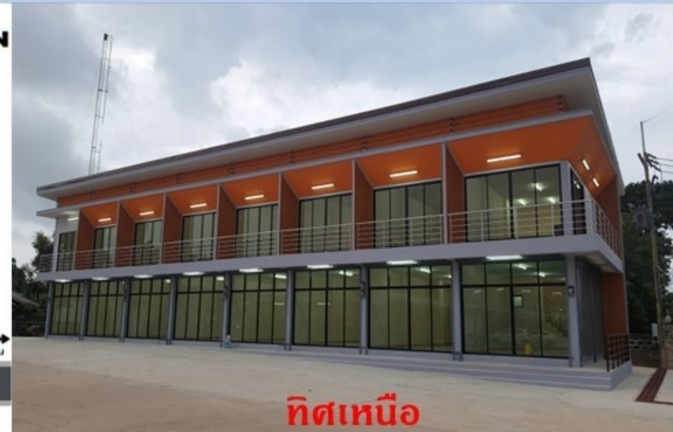
ทิศเหนือ