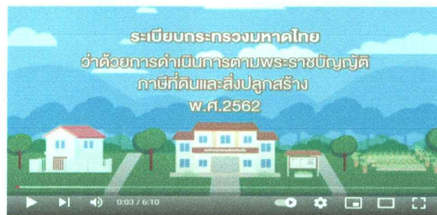
ระเบียบกระทรวงมหาดไทยว่าด้วยการดำเนินการตาม พ.ร.บ. ภาษีที่ดินและสิ่งปลูกสร้าง

➔ https://www.youtube.com/watch?v=_T1BZMqg7B4&t=80s